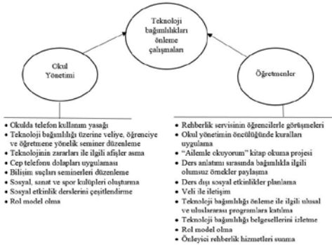
Şekil 2. Okul yönetimin ve öğretmenlerin öğrencilerde teknoloji bağımlılıklarını önleme çalışmaları

Öğrencilerimizin teknoloji bağımlılığı birçok yönden olumsuz etkiliyor en basitinden Türkçe konuşmakta zorlanıyorlar dilimiz de bu sayede bozuluyor. Kendilerince kısaltma sözcükler kullanıyorlar, yapma sözcükler kullanıyorlar, iki kelimeyi bir araya getirip cümle kurmakta zorlanıyorlar (Sibel).